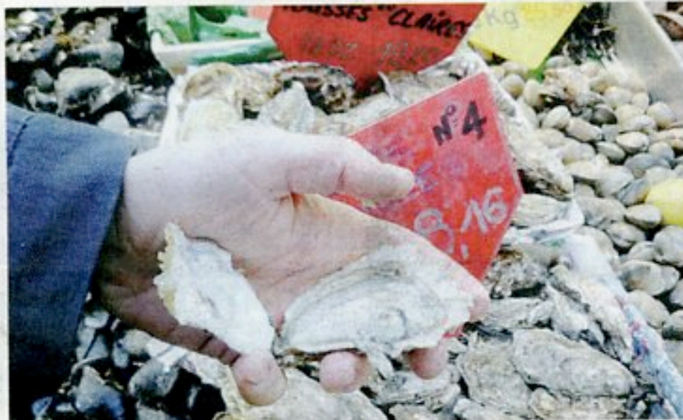
Ne jamais poser les huîtres sur de la glace car ça détruit son arôme.

Comme la plupart des coquillages et crustacés, l'huître est faible en calories (57 kcal/100g). Et manger des huîtres nous enrichit en oméga 3, des acides gras insaturés qui nous protègent des maladies cardio-vasculaires, alors pourquoi s'en priver? Choisissez vos huîtres vivantes, intactes et bien fermées. Si elle est ouverte, frappez-la : lorsqu'elle est fraîche, elle se referme. Elle doit être lourde, c'est le signe qu'elle a conservé son eau. En fonction du mode de dégustation, les huîtres sont classées par numéro. Plus le numéro est petit, plus elle sera grosse. Ainsi l'huître n° 0 est la plus grosse des creuses (la plus grosse des plates étant la n° 00 ou n° 000) tandis que la n° 5 sera la plus petite. A l'apéro, servez des n°5; des n° 3 ou 4 en entrée soit 9-12 par personne, ou seulement 6 sur un plateau de coquillages. Les n° 0, 1 et 2 sont idéales pour la cuisson; là aussi, 6 pièces suffiront à cha-